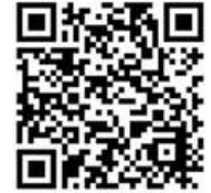
Biodiversidad de los "Jardines para Polinizadores Independencia"

Escanea el código QR y obtén más información sobre mí