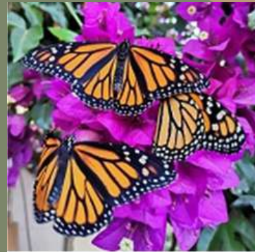
Danaus plexippus Mariposa Monarca

Avance del proyecto: elaboración de los letreros