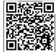
Biodiversidad de los "Jardines para Polinizadores Independencia"

Escanea el código QR y obtén más información de cómo crear Jardines para Polinizadores