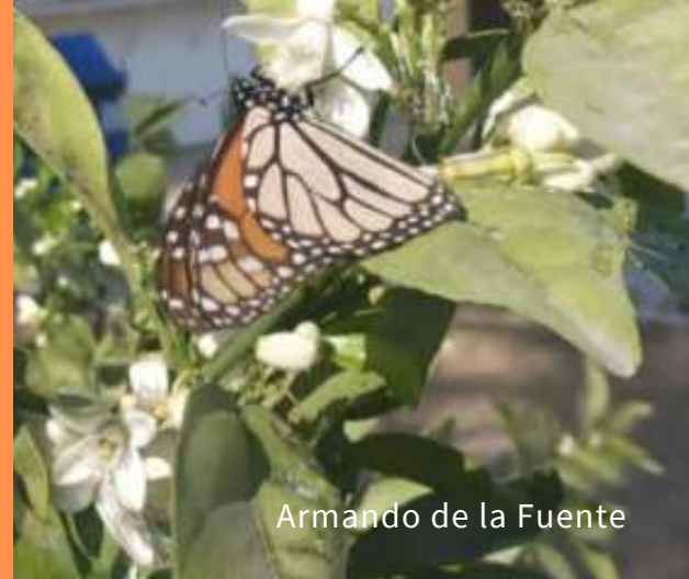
Armando de la Fuente